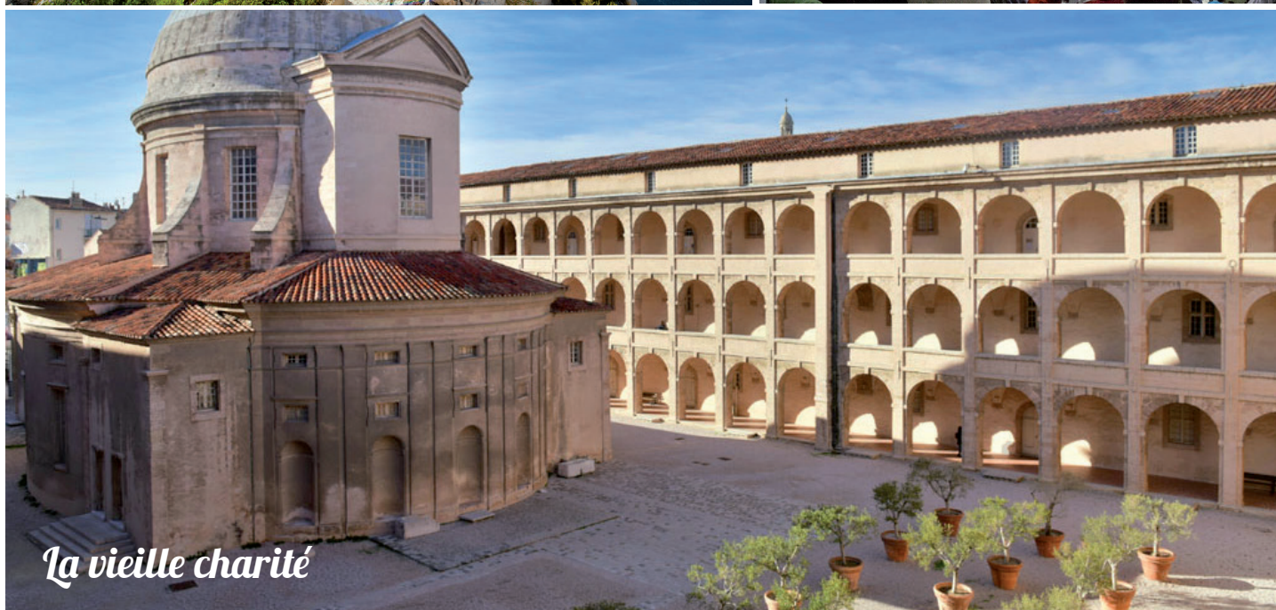
La vieille charité