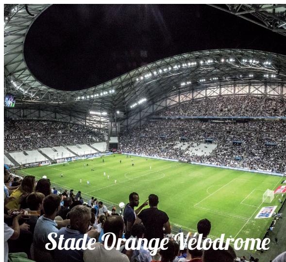
Stade Orange Vélodrome